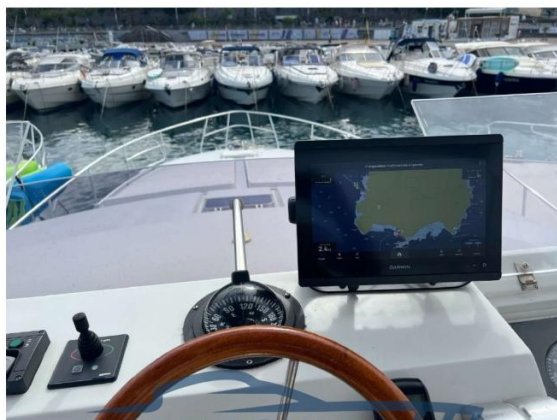
RAFFAELLI STORM S - REFITTING 2024

PLANCIA COMANDO FLY CON GPS GARMIN 12" NUOVO 2024 E NUOVA BUSSOLA VALBROKER