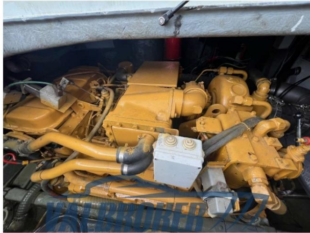
RAFFAELLI STORM S – REFITTING 2024