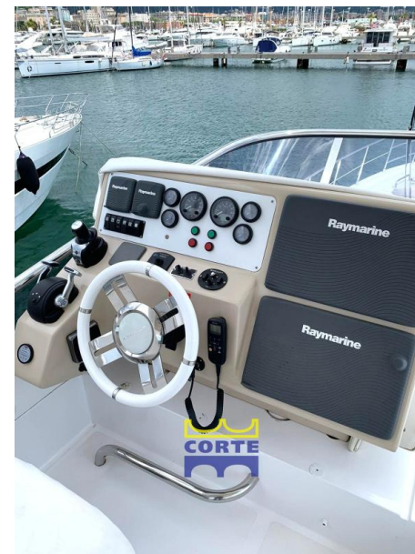
Azimut 64 Fly Layout: