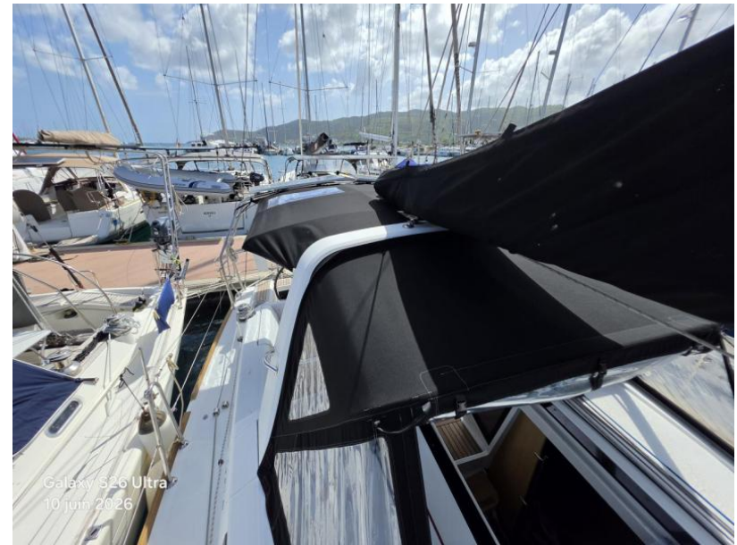
Galaxy S26 Ultra 10 juin 2026