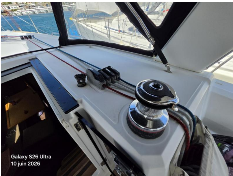
Galaxy S26 Ultra 10 juin 2026