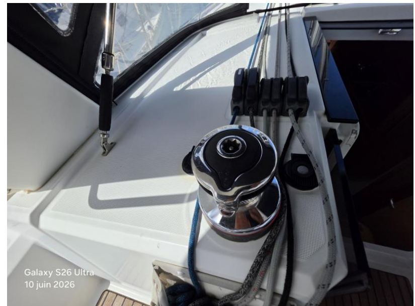
Galaxy S26 Ultra 10 juin 2026