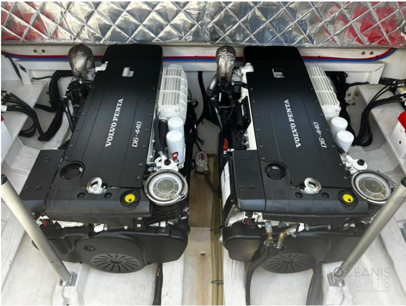
Main deck INBOARD