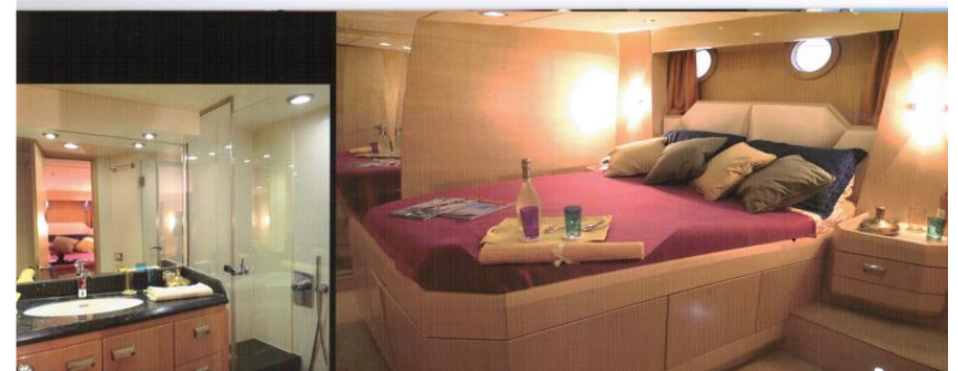
VIP CABIN / CABINA VIP