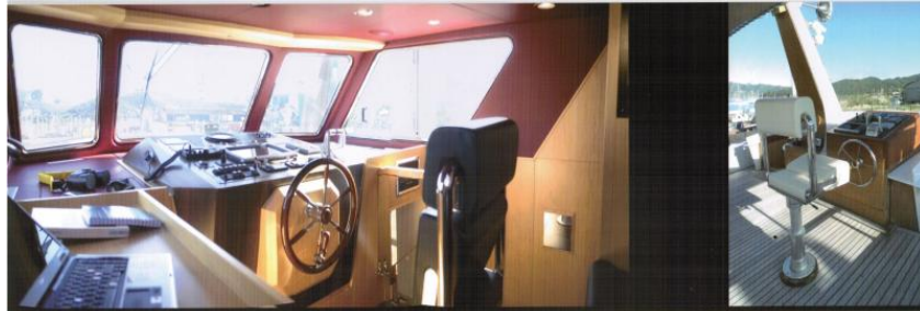
WHEELHOUSE / PLANCIA DI COMANDO