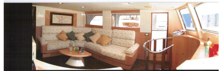
MAIN SALOON / SALONE PRINCIPALE DI PRUA