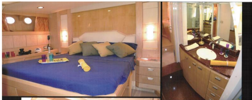
OWNER'S CABIN / CABINA ARMATORIALE