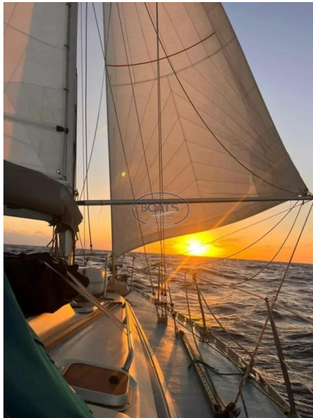
Bavaria 38 – 1987 Designer Axel Monhaupt