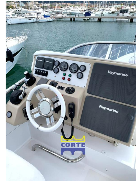
Azimut 64 Fly Layout: