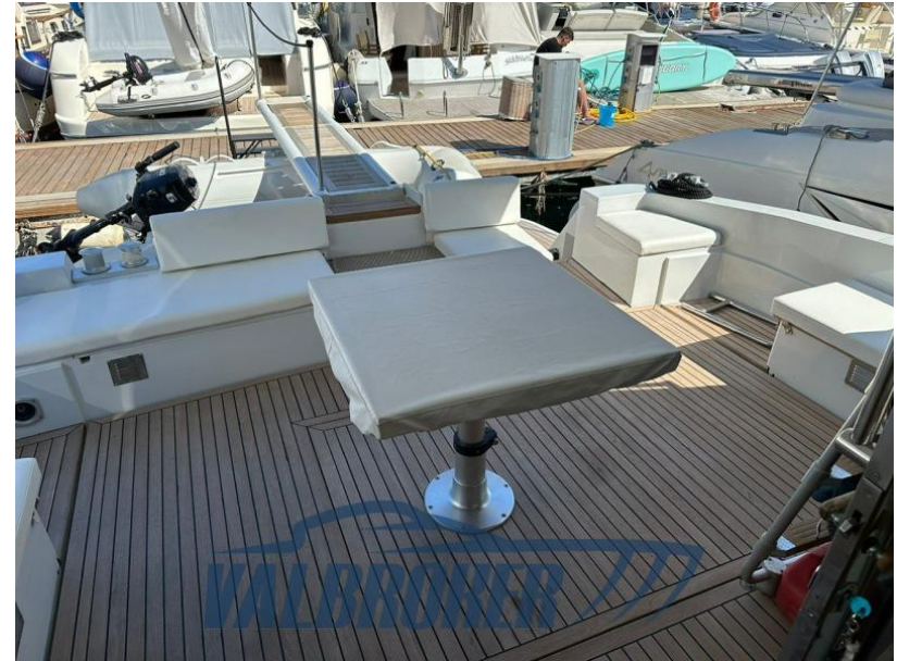
RAFFAELLI STORM S - REFITTING 2024