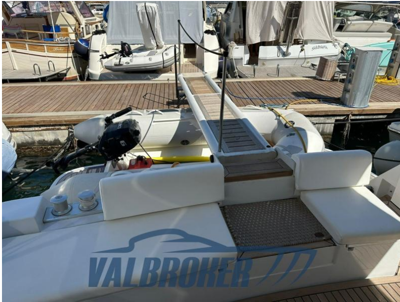
RAFFAELLI STORM S - REFITTING 2024