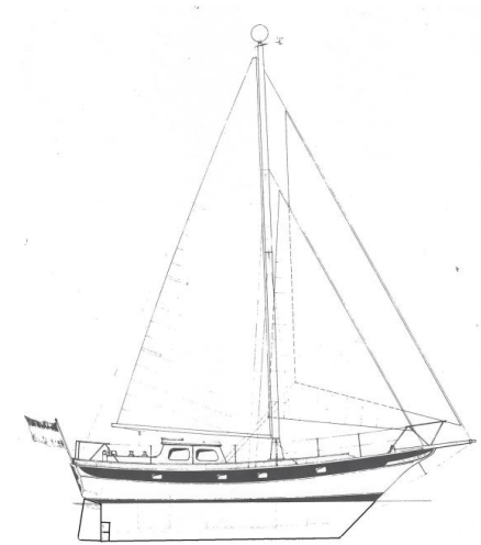
VERBAND UEKER YACHT- und BOOTSWERFF RENSBURG