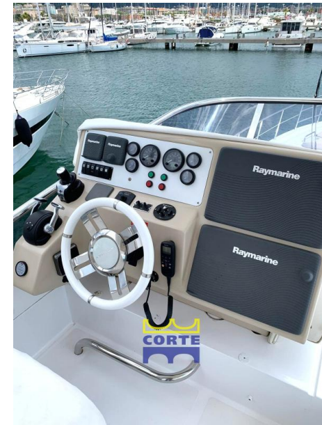
Azimut 64 Fly Layout: