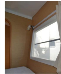
Lagoon 38 BAFAH