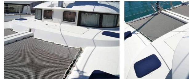
Lagoon 38 BAFAH