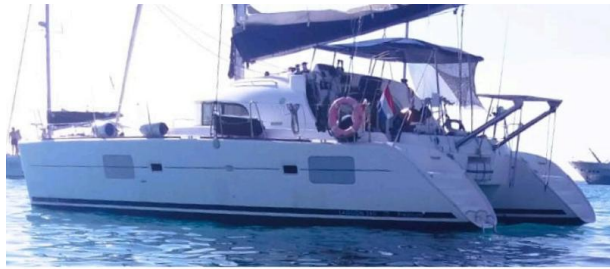
Lagoon 38 BAFAH