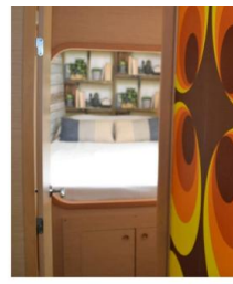
Lagoon 38 BAFAH