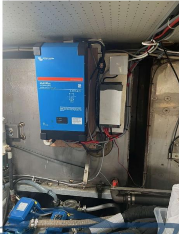
RAFFAELLI STORM S – REFITTING 2024