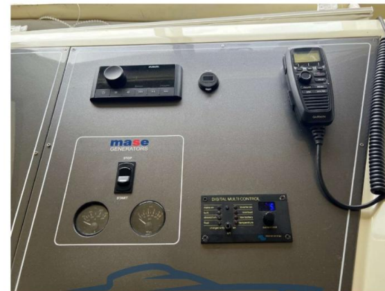
PANNELLO LATERALE PRUSOTTO INTERNO NUOVO 2024 INTEGRATO CON COMANDI GENERATORE MASE 6,5 KW E PANNELLO CONTROLLO CARICABATTERI INVERTER 2KW VICTRON NUOVO 2024