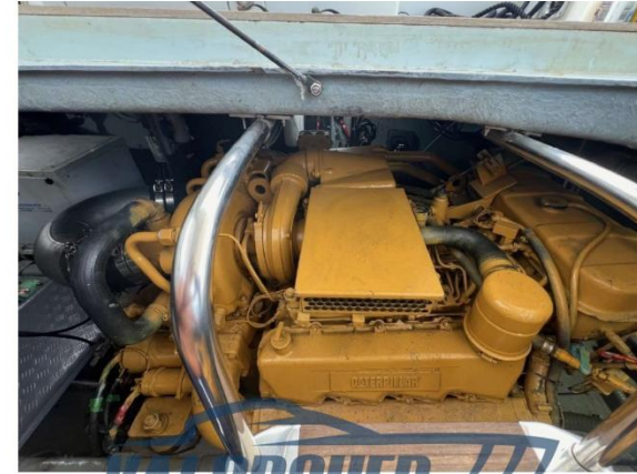
MOTORI SBARCATI AD ORE ZERO ANNO 2024