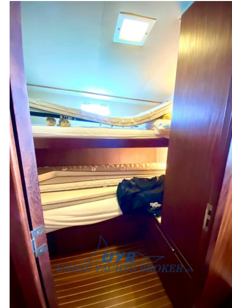
Hatteras 41 Convertible