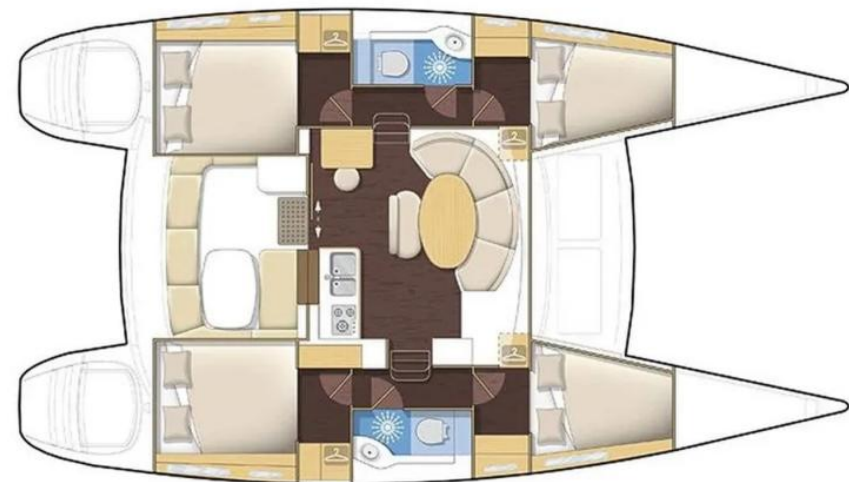
Version 4 cabines / 4 cabin version