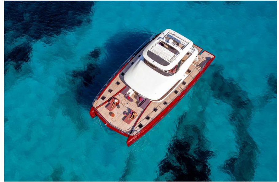
Lagoon Sixty 7