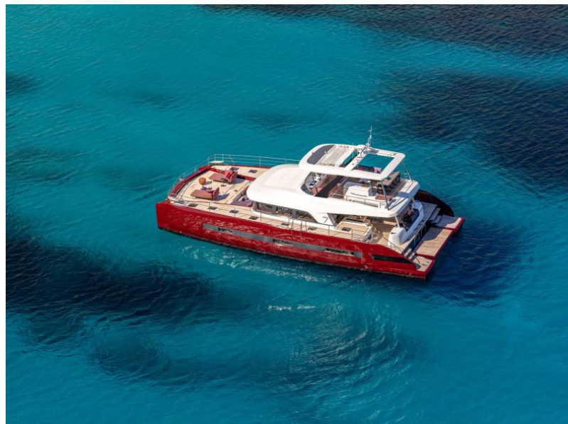
Lagoon Sixty 7