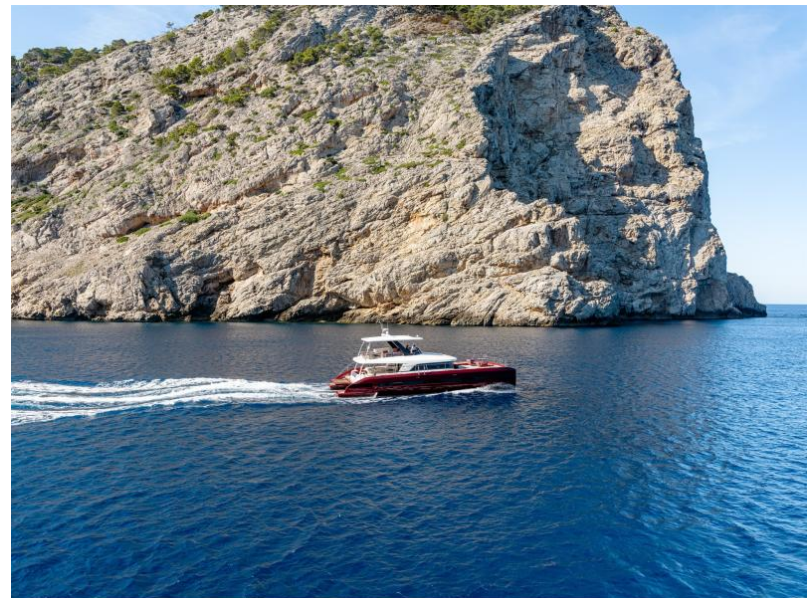
Lagoon Sixty 7