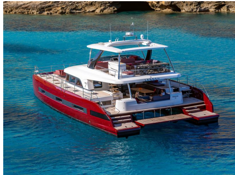
Lagoon Sixty 7