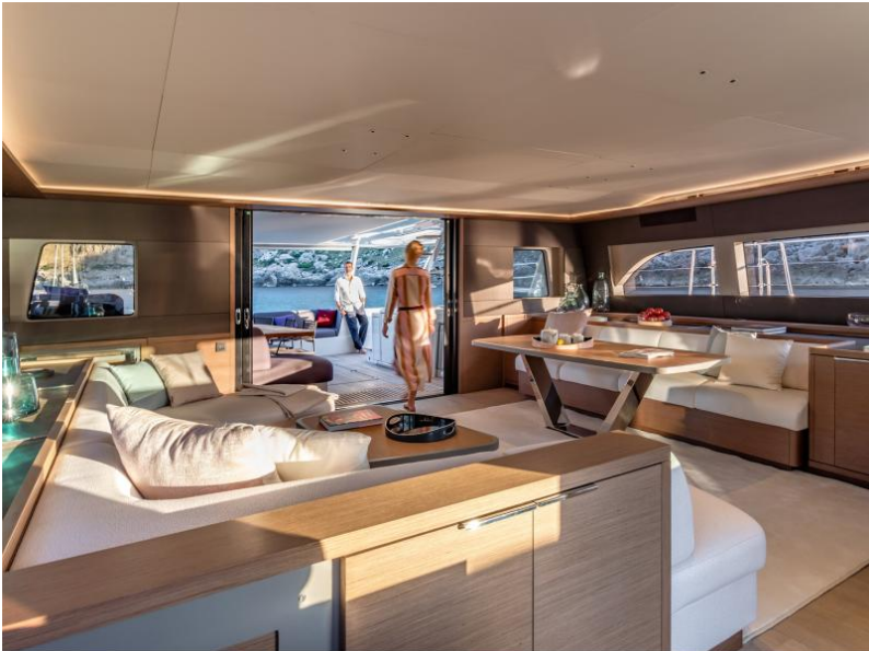
Lagoon Sixty 7 - Mention obligatoire/Mandatory credit: Photo Nicolas Claris