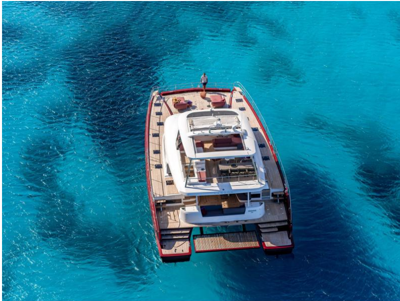
Lagoon Sixty 7