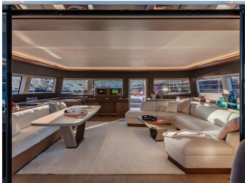
Lagoon Sixty 7 - Mention obligatoire/Mandatory credit: Photo Nicolas Claris