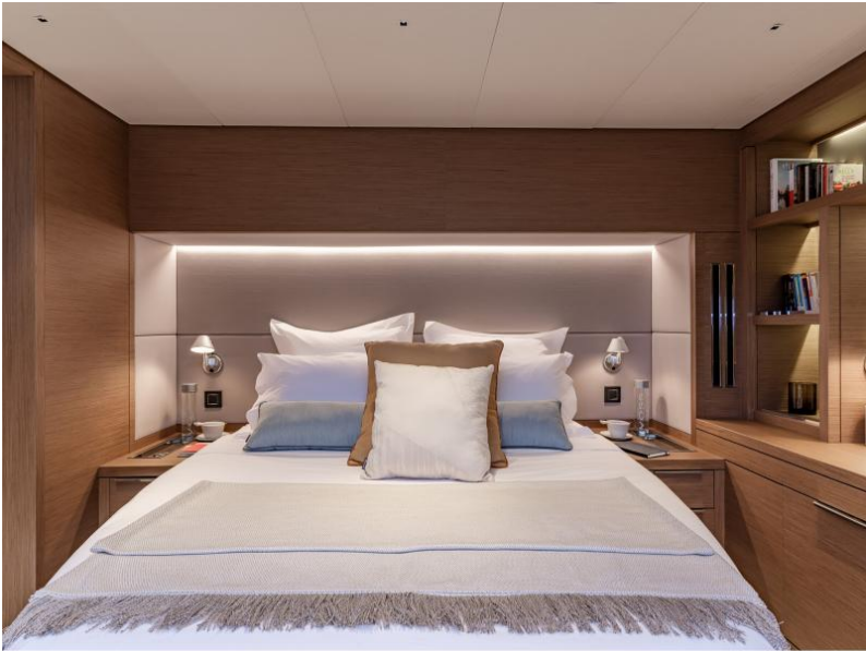
Lagoon Sixty 7