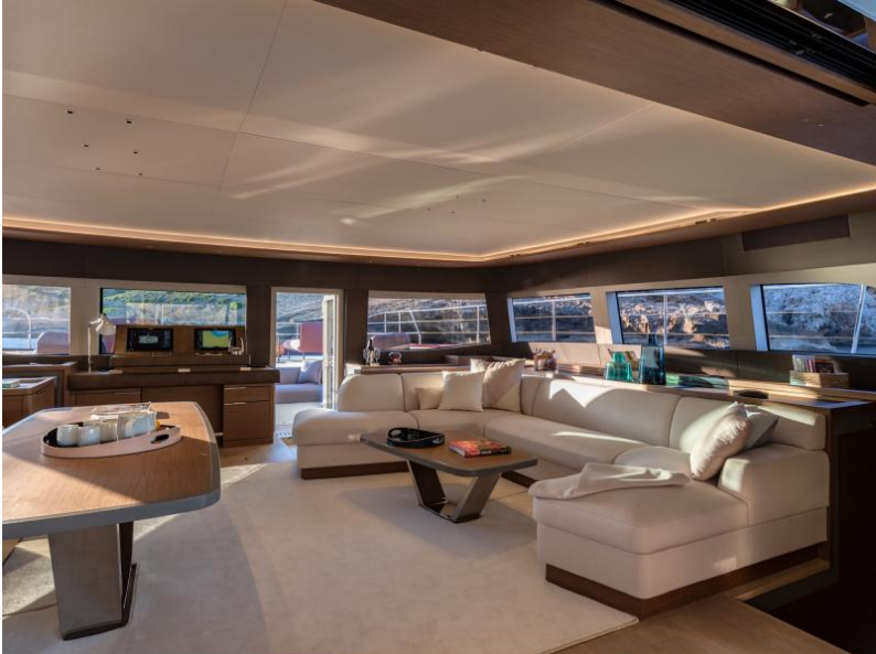
Lagoon Sixty 7