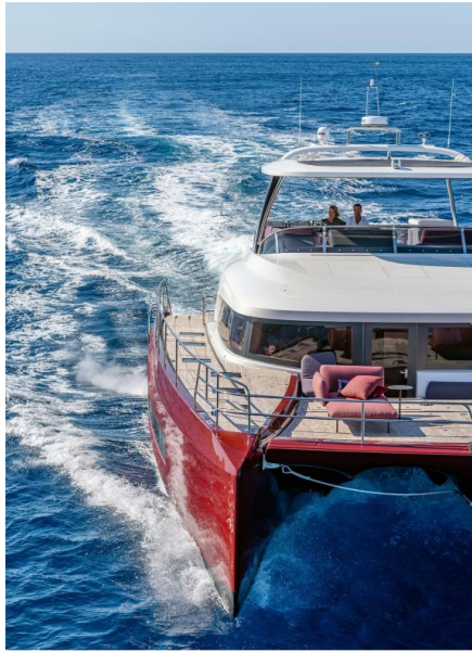
Lagoon Sixty 7 - Mention obligatoire/Mandatory credit: Photo Nicolas Claris