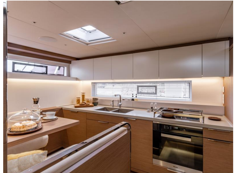
Lagoon Sixty 7