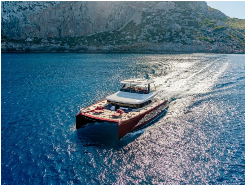
Lagoon Sixty 7