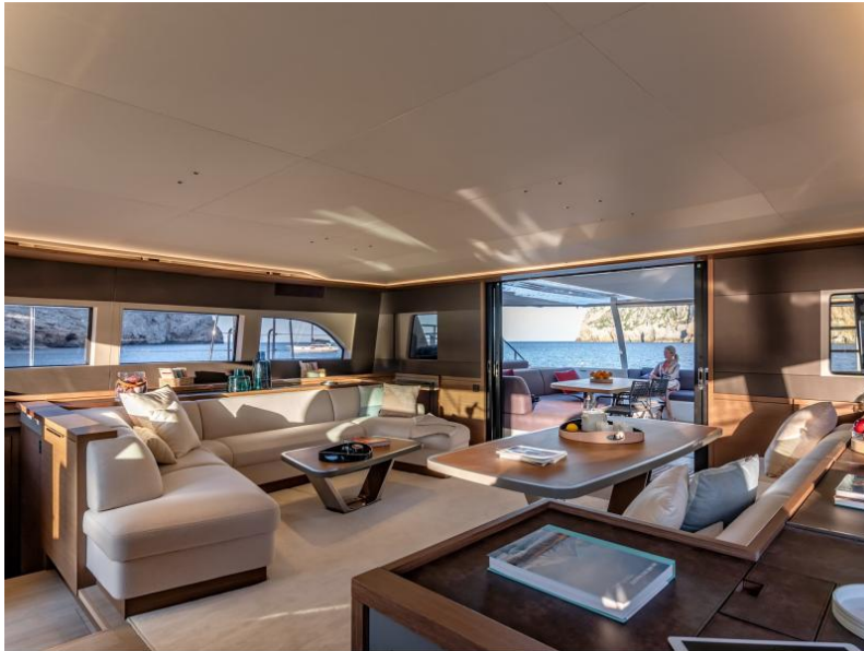
Lagoon Sixty 7