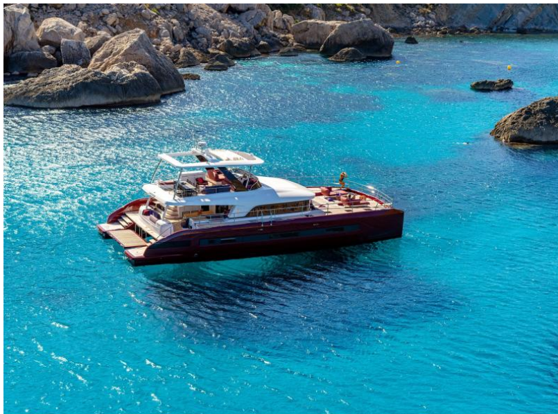
Lagoon Sixty 7