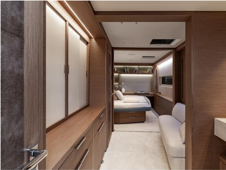
Lagoon Sixty 7