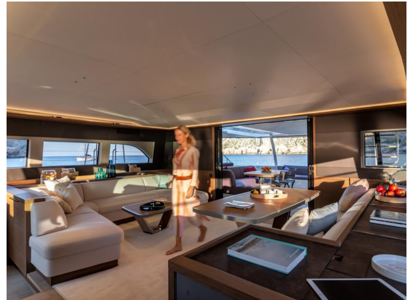
Lagoon Sixty 7