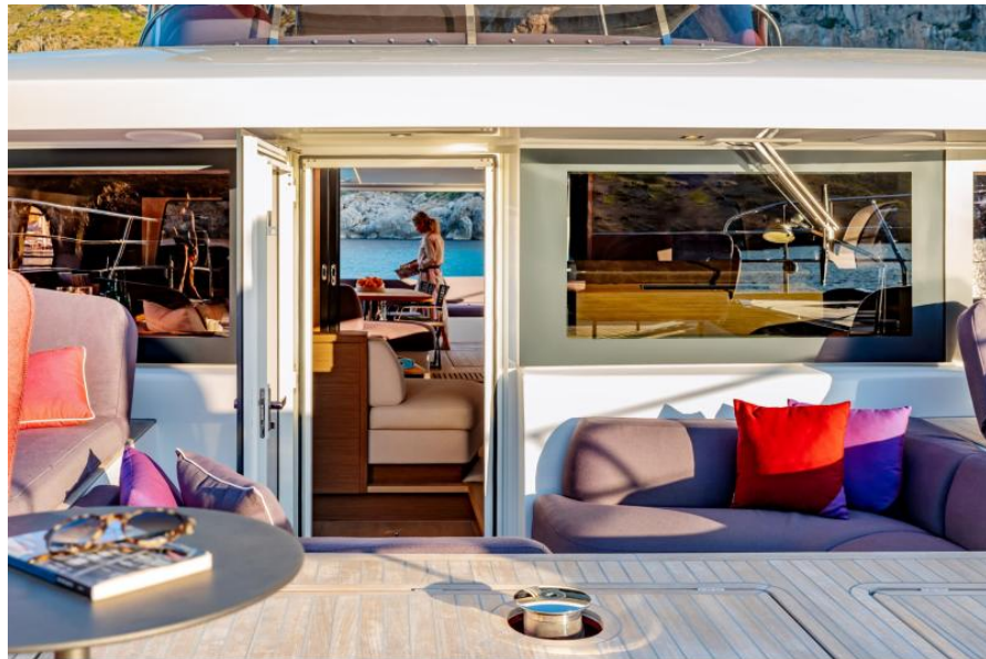
Lagoon Sixty 7