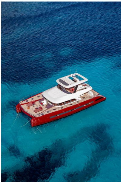
Lagoon Sixty 7