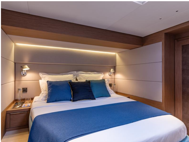
Lagoon Sixty 7