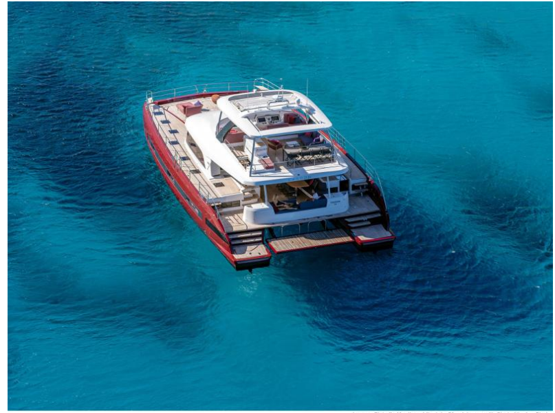
Lagoon Sixty 7