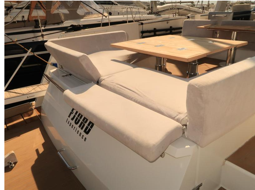
FJORD 52 open lower deck - option A2 / B2