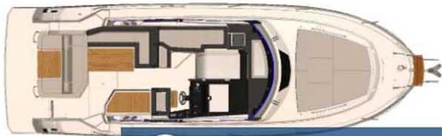
Cockpit top view