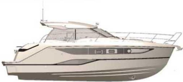
Exterior side view