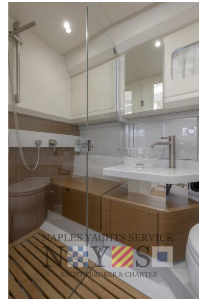
BG42 | 1 cabin, 1 bathroom -STD